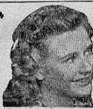
Priscilla Lane de la Warner Bros.